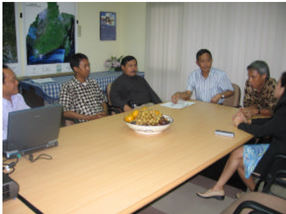
Gambar 1. Suasana Ruang Demo PUSDATA pada saat acara pemaparan materi hasil-hasil litbang/kerjasama.

Acara kunjungan diisi dengan pemaparan hasil-hasil litbang/kerjasama serta diskusi tentang Pemanfaatan Teknologi Inderaja Untuk Mendukung Perencanaan Dan Pengembangan Wilayah Di Provinsi Kalimantan Selatan. Selanjutnya rombongan Gubernur Provinsi Kalimantan Selatan mendapat kesempatan meninjau fasilitas Pusdata untuk menyaksikan proses produksi data satelit inderaja.